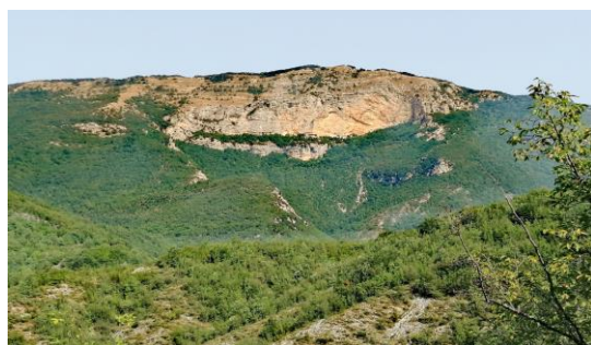
Colle della Tagliata