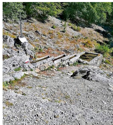
Fonte degli Scifi