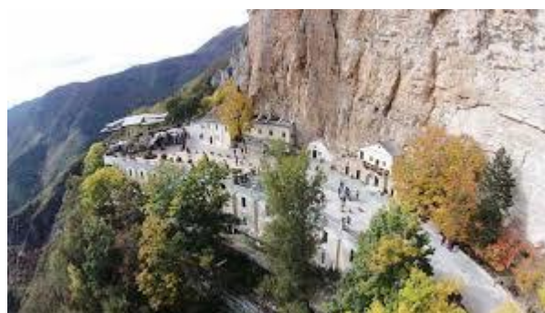
Santuario SS Trinità